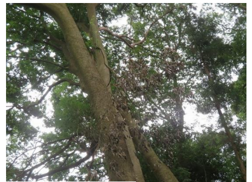
山側の倒木処理をチェーンソーで切断 水路の整備 園路の高所枯れ枝を処理