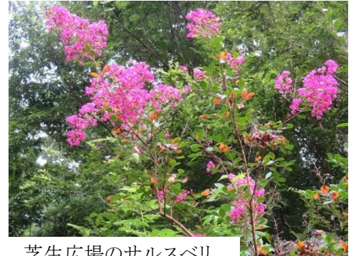
芝生広場のサルスベリ