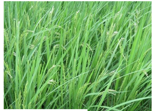
ミクリ池からの景観 ヨシがのびて～ 稲は順調に生育 稲穂が首部を垂れてきた…