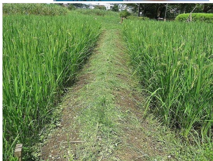
イネの生育は順調