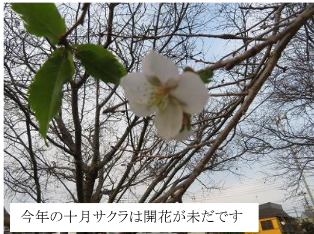
今年の十月サクラは開花が未だです