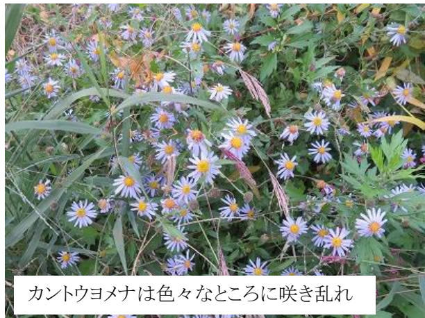
カントウヨメナは色々なところに咲き乱れ