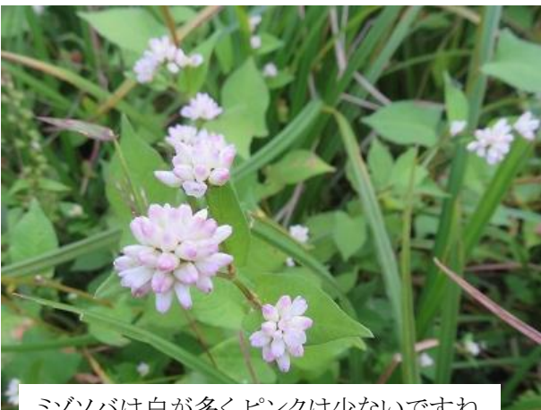
ミゾソバは白が多くピンクは少ないですね