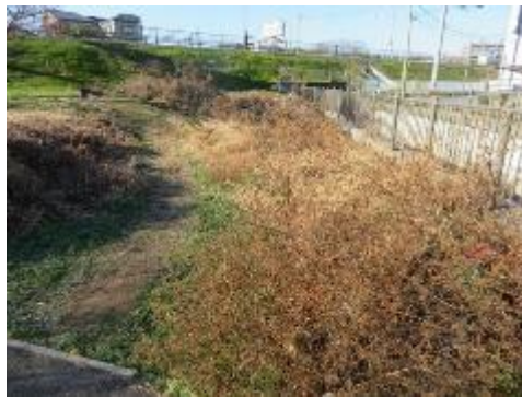
霜田橋から十月サクラ広場の周辺を除草整備、