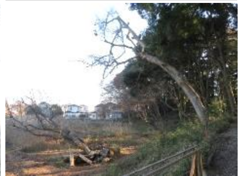
中央木道から園路に上がった所: コナラなどを伐倒