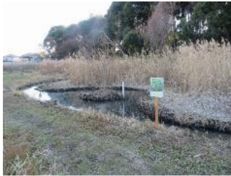
中央池の小島は子どもたちが遊んで危険なため整備を検討