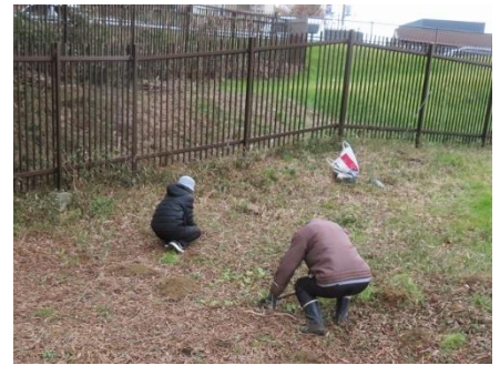
手作業の鎌で草取りです