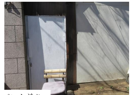
倉庫扉は白ペンキ塗り