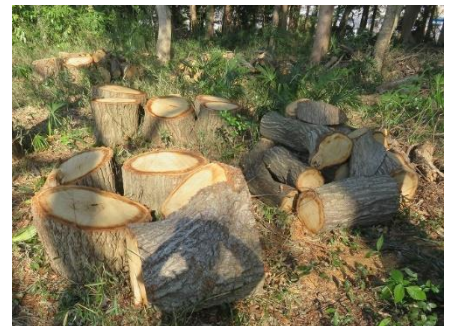
コナラの伐倒後の状態