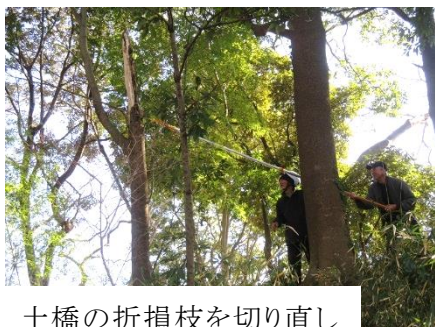
土橋の折損枝を切り直し