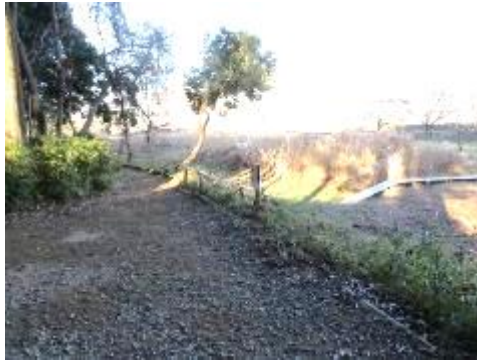
中央木道から園路への階段は丈夫に補修できて、園路の境は補修用板で整備を予定する。