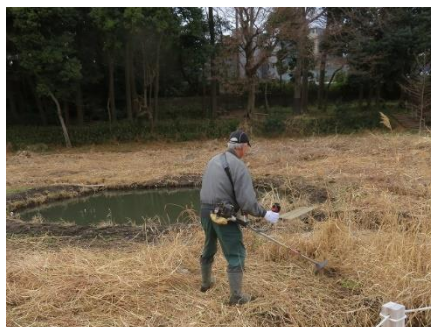
トンボ池周りの刈払機作業