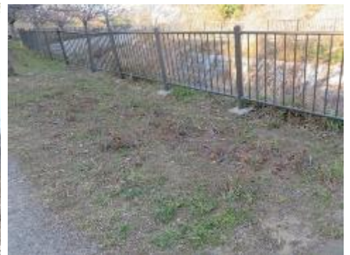
サクラ並木の下に植えているツツジなどが 荒れて見苦しい状態で、対策が必要