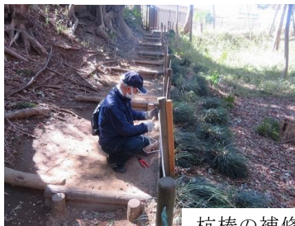
杭棒の補修・杭棒づくり