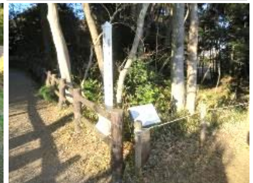
公園案内の陶板が太陽光で退色したのでどうするかを検討