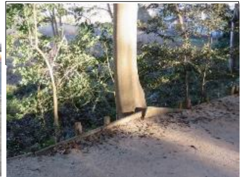
上と同様に板が外れて危険: 西原に修理指示