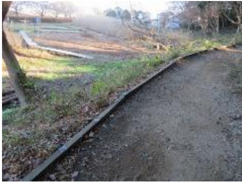
園路の縁は木道補修の残材を利用して綺麗に整備できている