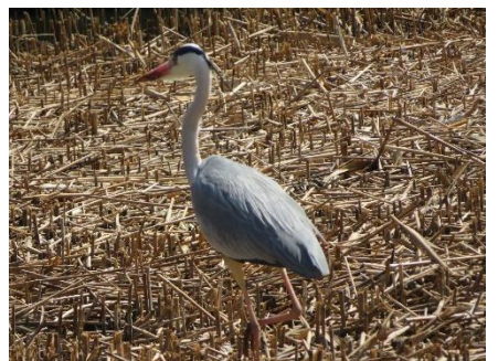
ネタが木製から金属に変わった ダイサギ