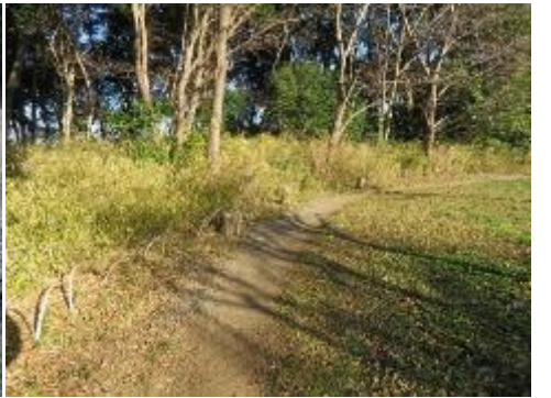
芝生広場のアジサイがパーゴラ左側が消えたので 植栽を検討