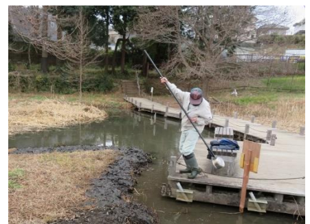
ハンノキ島周辺の浚渫作業