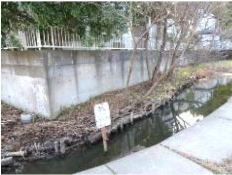
キショウブ池はだいぶ汚れのため、ヘドロを浚渫して整備を検討