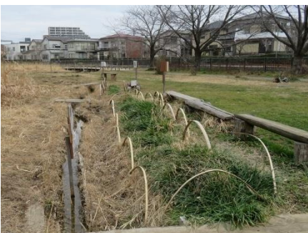
ここはヒガンバナの「花壇です