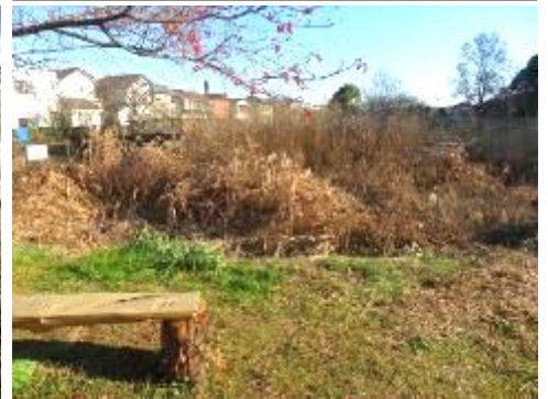
十月サクラの周辺を整備 木道の国道側のヨシ刈り 除草 国道下のトンネル付近の整備