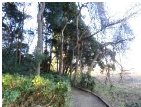
フジ蔓が巻付いて 咲かないフジ蔓は伐倒を検討