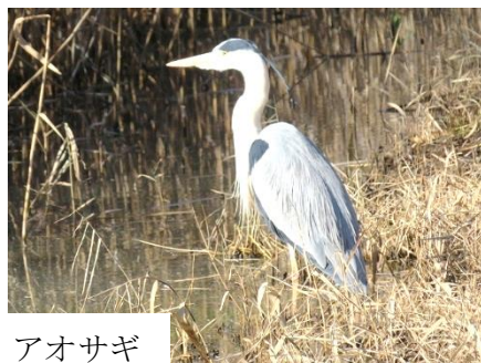
ダイサギ アオサギ