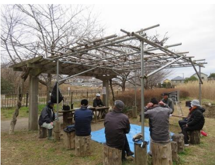
パーゴラのフジ蔓を剪定