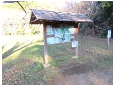
芝生広場の掲示板は脚のひび割れと柱の腐れのため、補修をどのようにするかを検討