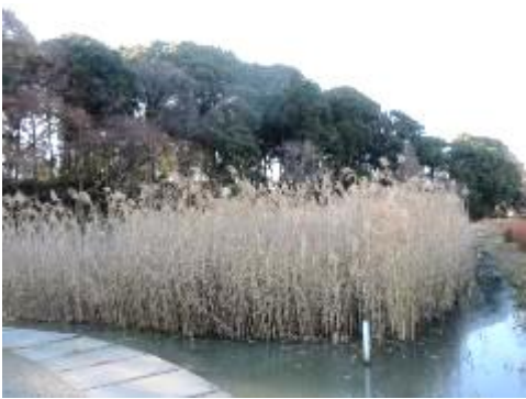
ミクリ池のヨシ刈りは 2～3 月に実施