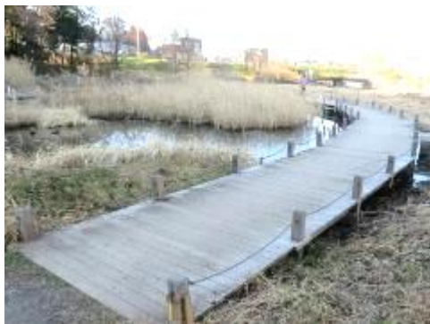
木道の補修工事は 2 年目、範囲と工事時期を決めて前回同様に表示水路の水は土囊 2 ヲ所で堰き止め