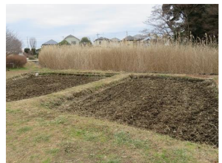
田んぼの土はよい色をしている