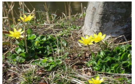
オオイヌノフグリ ヒメオドリコソウ、タンポポが咲き始め 姫立金花 ヒメリュウキンカ