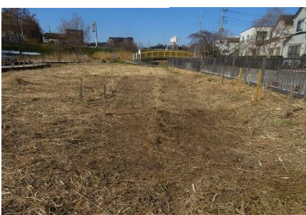
アリアケスミレ群生地の除草整備、ムクドリが虫探し