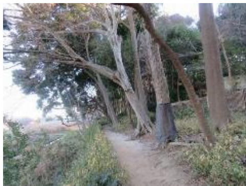
樹林下の園路から上をみると落枝が危険で、枝落とし