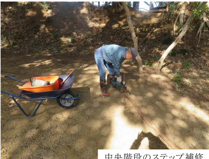
中央階段のステップ補修