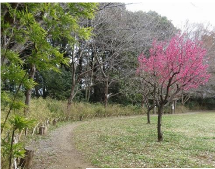
竹弓設置 勾配白梅が見頃になった

湿地パーゴラのフジは蔓が大分伸び放題になっているので 剪定です。田んぼの耕うんに続いて堆肥を均等にまかれるようにレイキで均し調整、水路脇の花壇に竹弓を設置、芝生広場のアジサイ並びに竹弓設置、トンボ池周りの除草、ハンノキ島辺りの整備などやっていると 寒さを感じませんね。