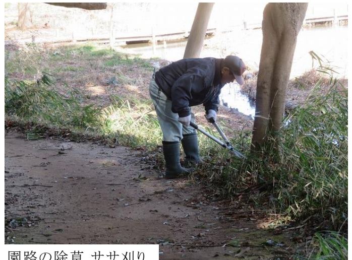
園路の除草 ササ刈り