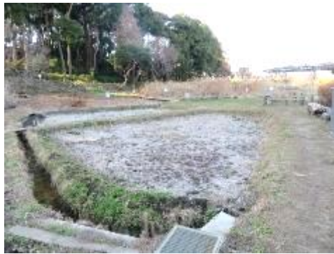
田んぼに堆肥入れは 1 月に実施、併せて耕うんを実施