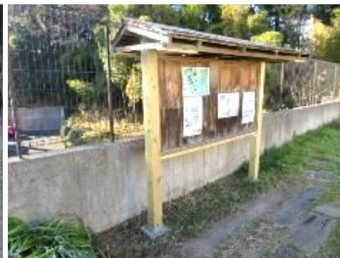
城址口の支柱が大分痛んで倒れそうな状況で、屋根を降ろして支柱を交換作業、頑張った交換作業。