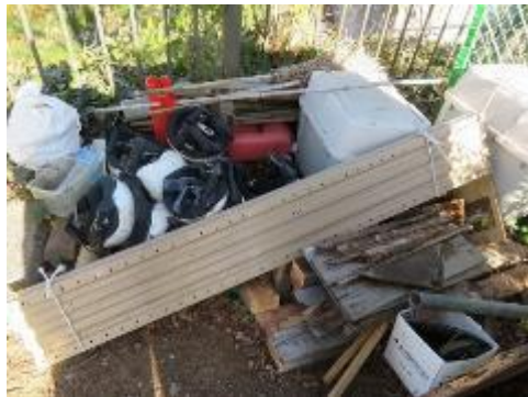
倉庫の棚入替えて廃棄物が多く別にロッカーなど、緑色のフェンスを廃棄、ボックス2ヶを残す