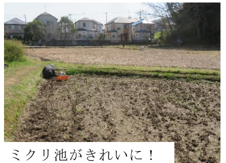
水路の整備 田んぼの除草、ミクリ池がきれいに！