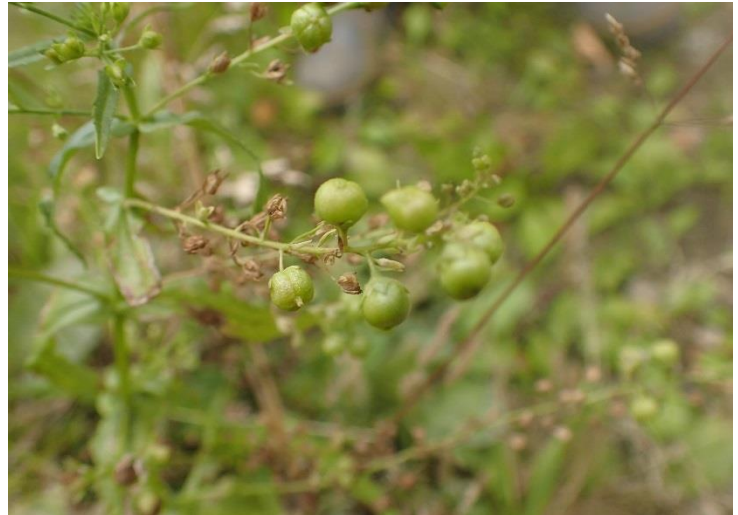
カワヂシャツボミタマフシ