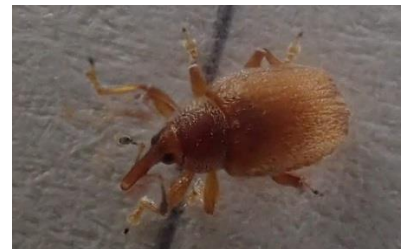
ゾウムシ現る (ムシクサコバンゾウムシ)