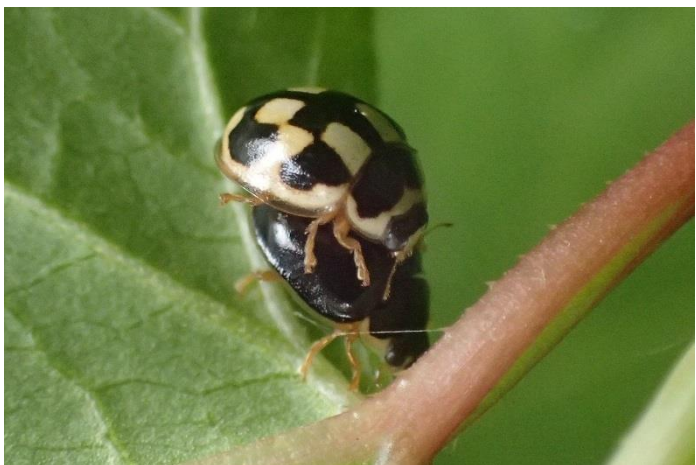
ヒメカノコテントウ

ヨシの密生度が増し、細くなっていることが気になります。この状態が続くとどうなるのか心配です。ヨシ刈りをしてないせいでしょうか？