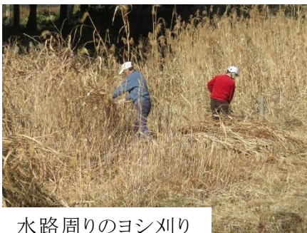
水路周りのヨシ刈り

今年最大の寒波が日本列島を覆い 北側：日本海側では大雪の報告が連日報道され、大変だな…という感じで、松戸に住んでいてそんな心配をしなくてよいことに幸せを感じたりしています。今年の節分は2月2日（日）で2月3日が春分、1897年(明治30)年以来124年ぶりに2月2日になる。節分は本来、四季を分ける節目のこと。このうち春の始まりを表す立春の前日の節分は、豆まきをしたり、恵方巻きを食べたりと特になじみが深い。立春はここしばらく2月4日だったけど、今年は1日早まるため、節分も2月2日になる)とのこと。今年は豆まきをやらなかった、恵方巻は太いままだと前歯に負担がかかるため小さく切って食べました。高齢化の悲哀ですか。夫々に作業をしました。