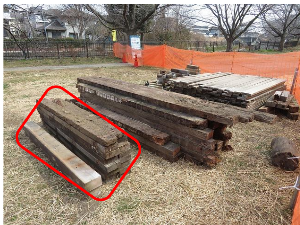
赤印を付けた材の山を受取り、他は廃棄