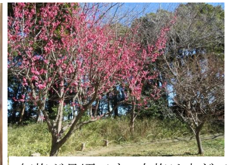
紅梅が見頃です、白梅は未だです