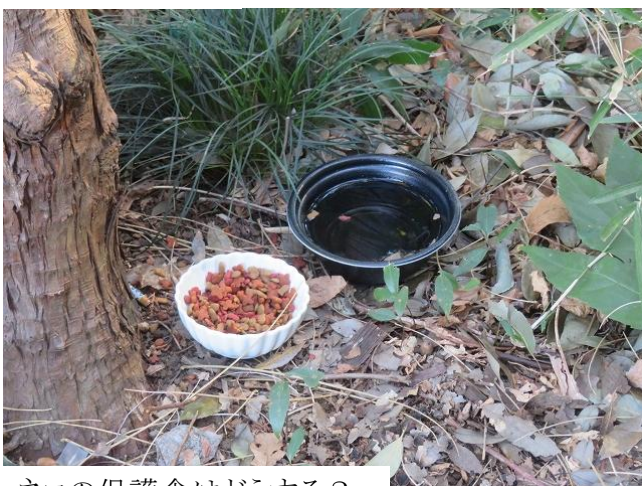
ネコの保護食はどうする？