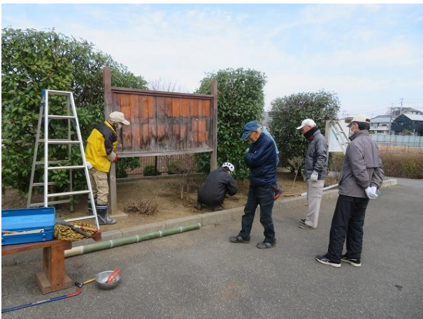
掲示板の取外し作業