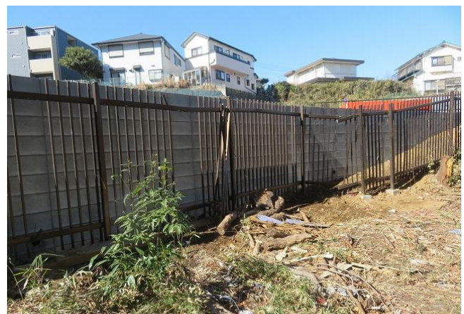
隣地の造成による塀の破損は公園緑地課が対処