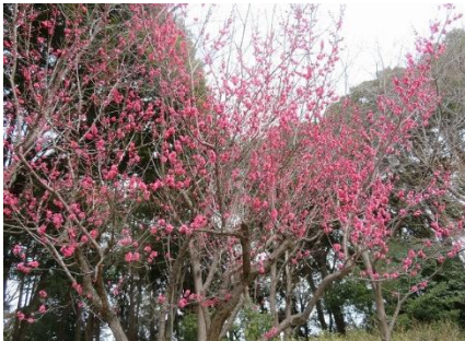
芝生広場の紅梅・白梅は見ごろで、ソシンロウバイもよい香りで楽しむ

①園路のサクラ並木にあるツツジの移植は、先週 8 本、今日は 10 本を掘り起こして 一輪車ネコで霜田橋辺りに移植作業、肥料は後日に施肥予定で植替え後に水遣りで、次回は残りの 10 本を移植予定。②手前の池と木道沿いのヨシを根元から刈って浚渫も実施で力仕事です。③中央木道の左右の法面のササや草刈りを実施して湿地中央部のヨシ刈りもだいぶ進んで作業できている。④ミクリ池の縁もヨシを根元から刈って浚渫を実施、⑤十月ザクラの川側フェンスに絡むカナナムグラ・クズ・ヤブカラシン等々が見難く フェンスに絡み 除去に一苦労、この地区一帯は西原造園に作業依頼がよいとの意見。⑥倒木のコナラ丸太切り 10 ヶの運び出しは、草が生える春前に実施したいとの意見で、次回にリヤカーを出して広場・サクラ並木まで運ぶ提案、