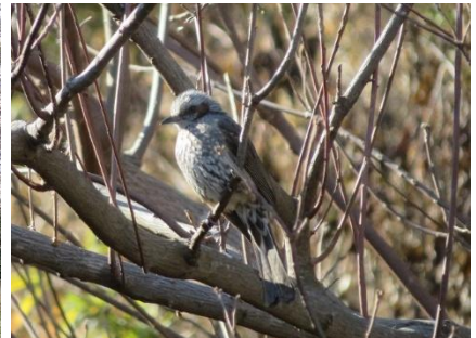
ヒヨドリが忙しそう