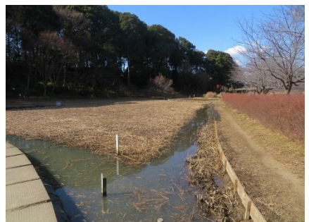
綺麗に刈ったミクリ池でカルガモやムクドリが楽しそう、雪が降るとなお綺麗に見えるでしょう