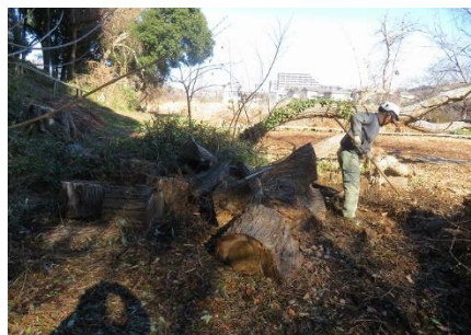
コナラ丸太切り周りを整備作業