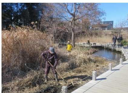
木道脇の水辺を除草整備