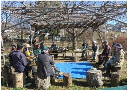
休憩時間で自転車事故も話題でした