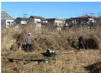
中央池のヨシ刈り整備は刈払機で作業