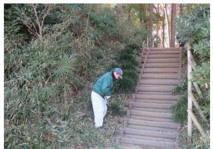
中央階段周り除草整備