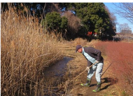
ミクリ池の通路側のヨシを根元から除去