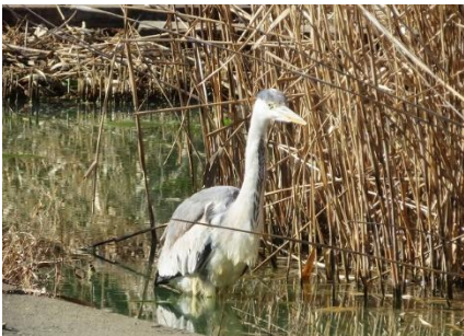
アオサギが水辺でじっとして小魚を…

久し振りにアオサギがミクリ池でじっとして小魚を狙って、メジロやスズメがヨシ原で虫を啄んで賑やかに飛び回っている。十月サクラは未だ咲いているが、近くにみるとたくさん観られます。