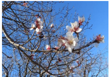
十月サクラは未だみられます