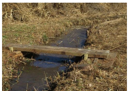
水路の橋を交換整備