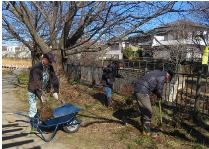
桜並木下のツツジを霜田橋辺りに移植で移植の作業