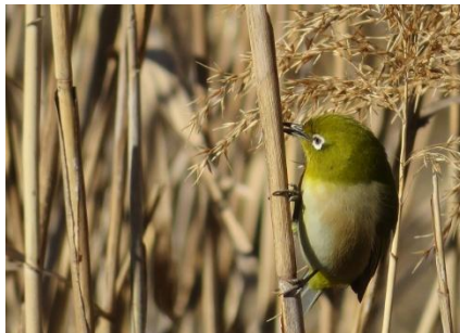
メジロがヨシの虫を食べている